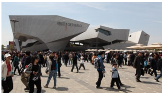
Bereits in den ersten Tagen kamen zehntausende Besucher, um den Deutschen Pavillon zu sehen.