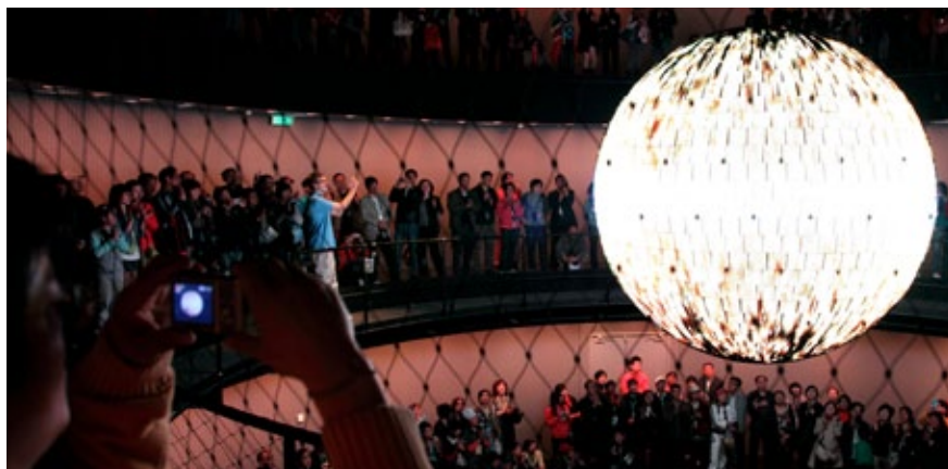
Bis zu 600 Besucher können gleichzeitig die Vorstellung in der Energieshow miterleben.