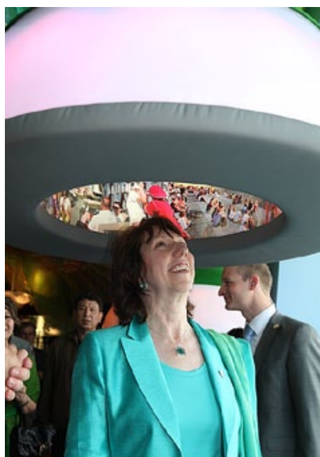
Lady Catherine Ashton beim Besuch im Pavillon am Eröffnungstag

Ashton war zutiefst beeindruckt von balancity und sagte, dass keine andere Nation auf der