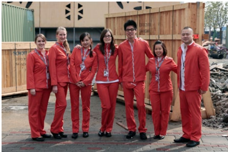
Host und Hostessen in ihren Uniformen