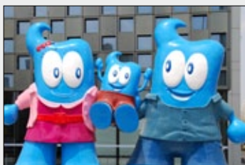
Haibao, der "Schatz des Meeres", ist das Maskottchen der EXPO 2010.

Bisher wurden mehr als 22 Millionen Tickets verkauft, und schon über 12.000 internationale Journalisten haben sich akkreditiert. Während der Weltausstellung bieten mehr als 70.000 Freiwillige verschiedene Dienstleistungen wie Dolmetschen an und die Besucher empfangen. 70 Prozent der Ausstellungshallen im EXPO-Park wurden schon am 20. April 2010 probeweise in Betrieb genommen. Zur Eröffnung am Samstag, den 1. Mai kamen mehr als 200.000 Besucher auf das EXPO-Gelände. Der Deutsche Pavillon zog allein in den ersten drei Tagen rund 52.500 Besucher an.